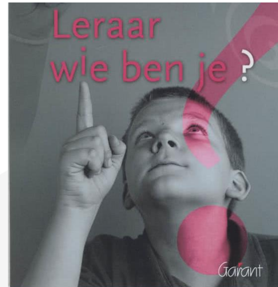
Stevens, L. (red), Leraar wie ben je? Garant, 2008

Maar: als het plan in werking treedt laten leerlingen en leraar zien wie ze zijn