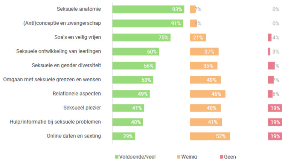
Figuur 2. Mate van aandacht voor verschillende onderwerpen op de lerarenopleiding volgens aankomende docenten (N=68)