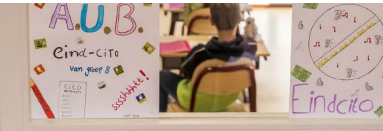
▲ Ga na de Citoperiode wekelijks naar een middelbare school.